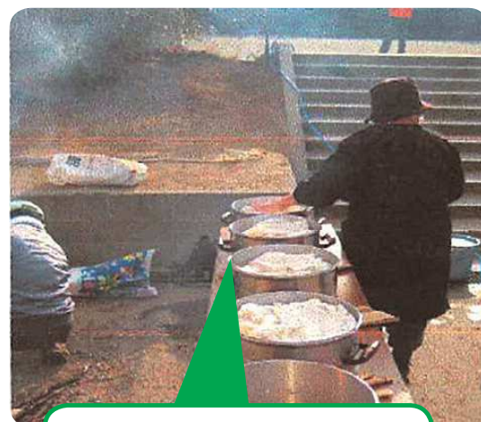
仕込みは経験豊かな 近所の方々にご協力 いただきました (前日の準備も)