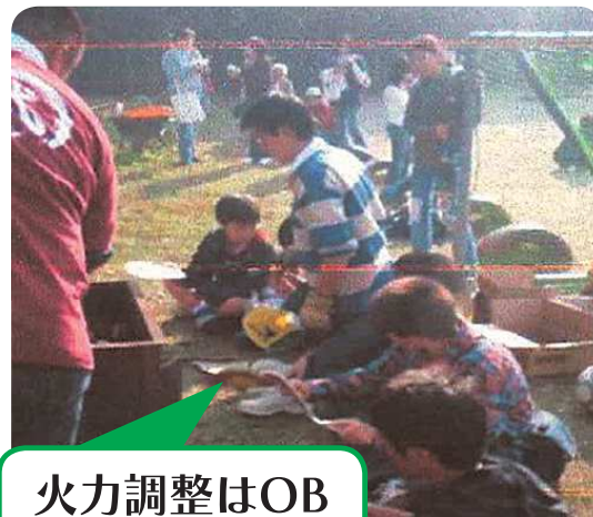
火力調整はOB (中学生)が対応