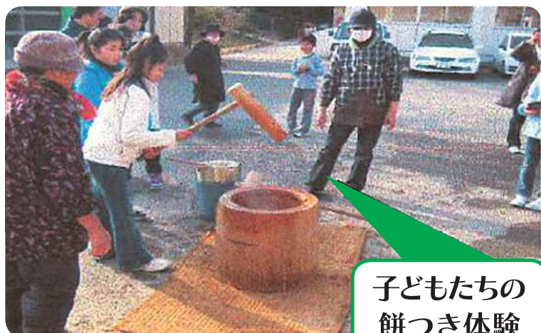
子どもたちの 餅つき体験