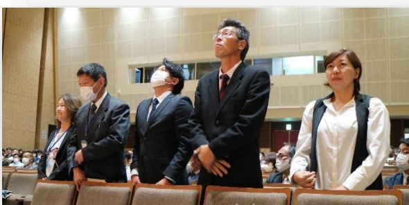
感謝状を受賞され た皆様