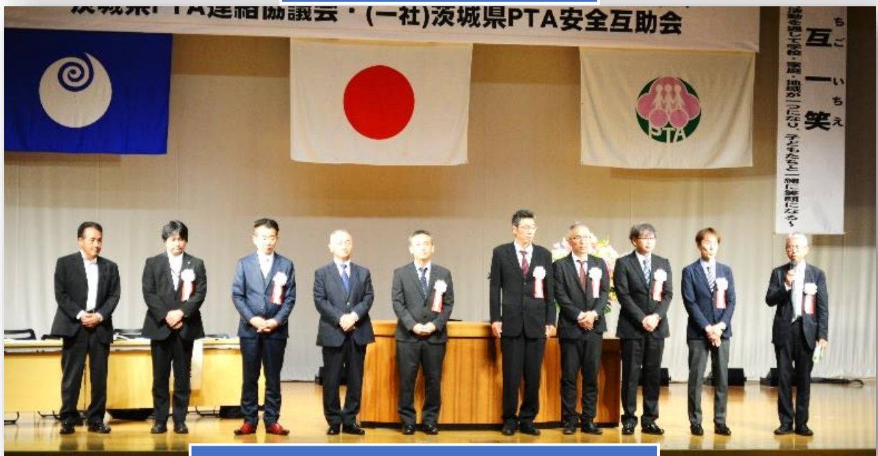
一般社団法人茨城県PTA安全互助会新役員