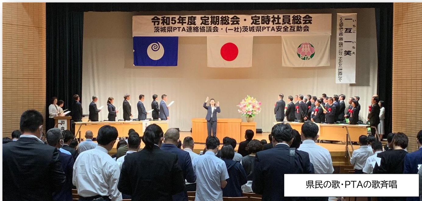
県民の歌・PTAの歌斉唱