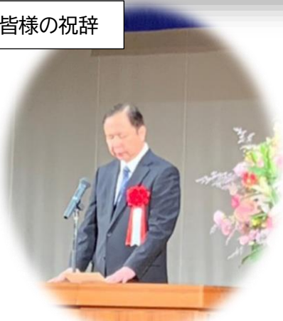
茨城県教育委員会教育長 森作 宜民 様