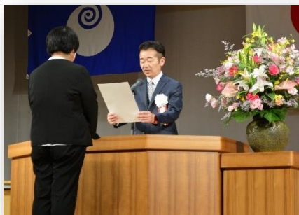
書き損じはがき讚該当PTA [大子町PTA連絡協議会]