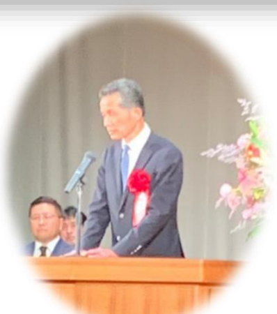
笠間市長 山口 伸樹 様