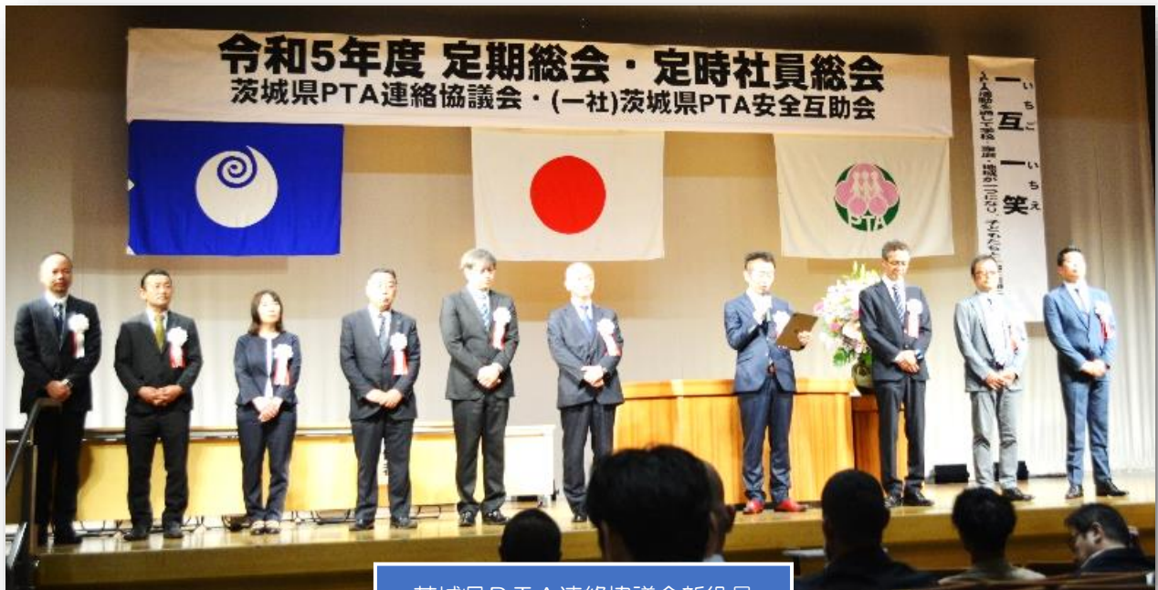
茨城県PTA連絡協議会新役員